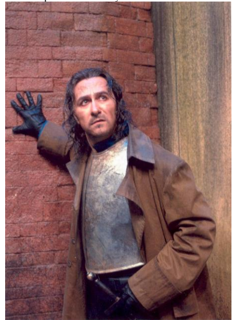
Hamlet, Gran Teatre del Liceu