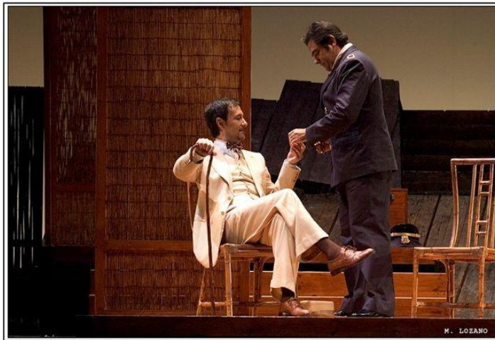
Madama Butterfly, Teatre Calderón Valladolid