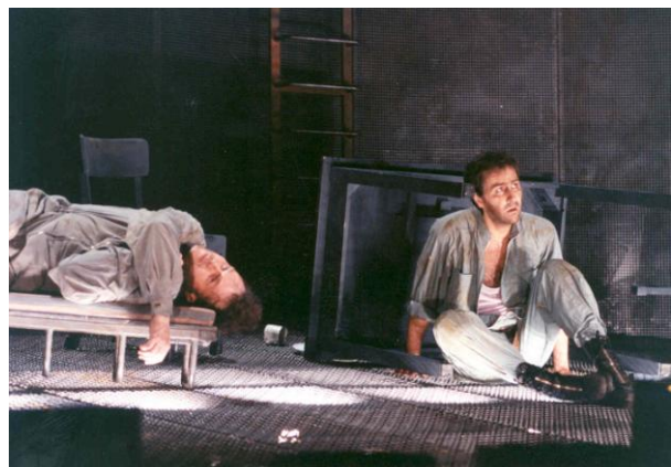
The Lighthouse, Gran Teatre del Liceu