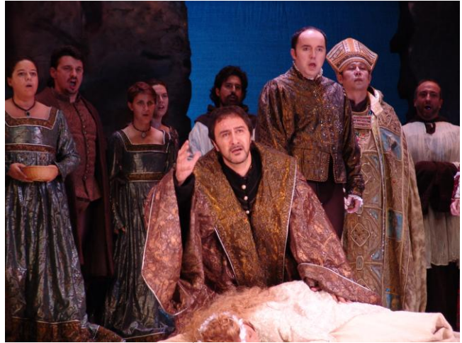
Romeo et Juliette, Cicle d'Òpera a Catalunya