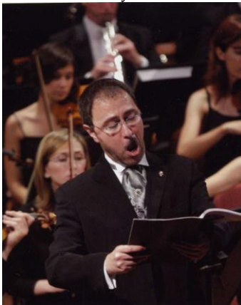
Belshazzar's Feast, Palau de la Música Catalana